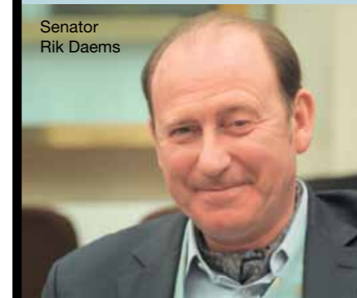
Senator Rik Daems

roerende voorheffing, zoals dat nu het geval is voor spaarboekjes. Op die manier doen spaarder en overheid een goede zaak. Een spaarboekje brengt vandaag de dag amper 2% interest op, wat lager is dan de inflatie in 2011. Kortom, op een spaarboekje verlies je geld. Een staatsobligatie levert in 10 jaar tijd dubbel zoveel interest op. De Belgen blijven fervente spaarders. De vele spaarboekjes die ons land rijk is, zijn goed voor maar liefst 200 miljard euro. Op de eerste schijf van 1.770 euro interest, hoef je als spaarder geen 15% roerende voorheffing te betalen. Die belasting betaal je wél op staatsbons en -obligaties. Rik Daems wil deze belasting afschaffen, zodat staatsobligaties een interessanter beleggingsproduct worden.