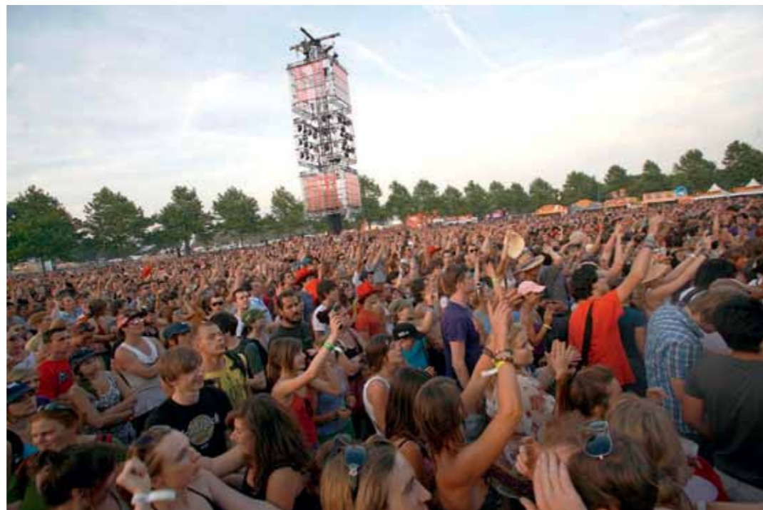
Met haar voorstel over de geluidsnormen schiet de Vlaamse regering heel Vlaanderen in de voet.

Enkele dagen later stelde de Vlaamse regering een akkoord voor over de hervorming van de verkeersbelasting en de invoering van een verkeersvignet voor vrachtwagens. Twee maanden voordien had Sas van Rouveroi minister van Mobiliteit Hilde Crevits een studie van haar eigen Steunpunt onder de neus geduwd. Die studie