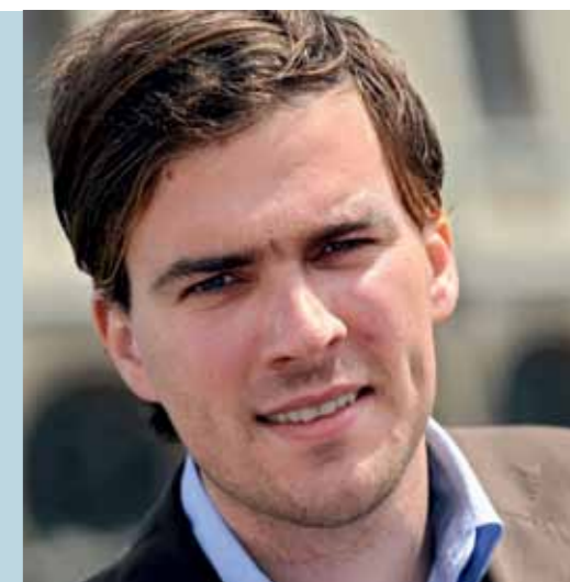
Volksvertegenwoordiger Mathias De Clercq

Als Gentse schepen van Middenstand heeft volksvertegenwoordiger Mathias De Clercq (Open Vld) oog voor het wel en wee van de zelfstandigen. Uit cijfers blijkt dat in 2004 ruim 17.863 zelfstandigen een aanvraag voor vrijstelling van sociale bijdragen indienden en dit aantal in 2009 al naar 27.528 gestegen was. Het aantal arme zelfstandigen stijgt dus gevoelig, terwijl vrijgestelde sociale bijdragen sinds 1981 geen pensioenrechten meer opleveren. Om hieraan het hoofd te bieden, diende De Clercq een wetsvoorstel in om de vrijgestelde kwartalen opnieuw als 'betaald' te beschouwen. Hij pleit er ook voor om de sociale bijdragen aan te passen aan de individuele situatie van elke zelfstandige: "Sociale bijdragen zouden berekend moeten worden